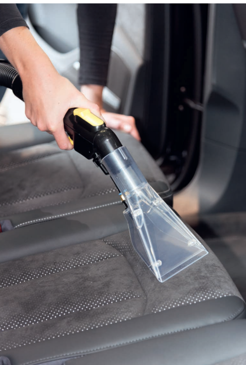
Glasklare Polster-Sprühdüse zur Reinigung von Polstermöbeln oder Fahrzeugsitzen. Ergonomischer Handgriff mit handlichen, bequemen Bedienelementen. Die Sprühfunktion ist per Bedienhebel am Handgriff dosierbar.