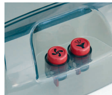
Sprüh- und Saugfunktion sind einzeln am Gerät zuschaltbar.