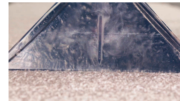
Anschließendes Aufsaugen des Schmutzes, inkl. Flüssigkeit.