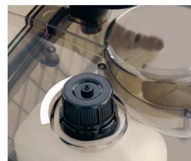
Ein separater Tank ermöglicht den Betrieb mit Entschäumer und garantiert damit ein kontinuierliches Arbeiten.