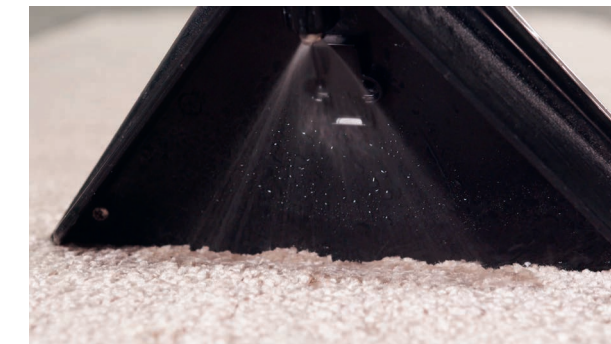
Reinigungsmittel wird bei Bedarf aufgesprüht.