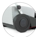
Hinterräder mit großem Durchmesser