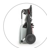
Kompakte Abmessungen: problemlos zum Aufbewahren