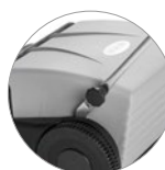
Praktisches System für eine schnelle Blockierung des Griffs